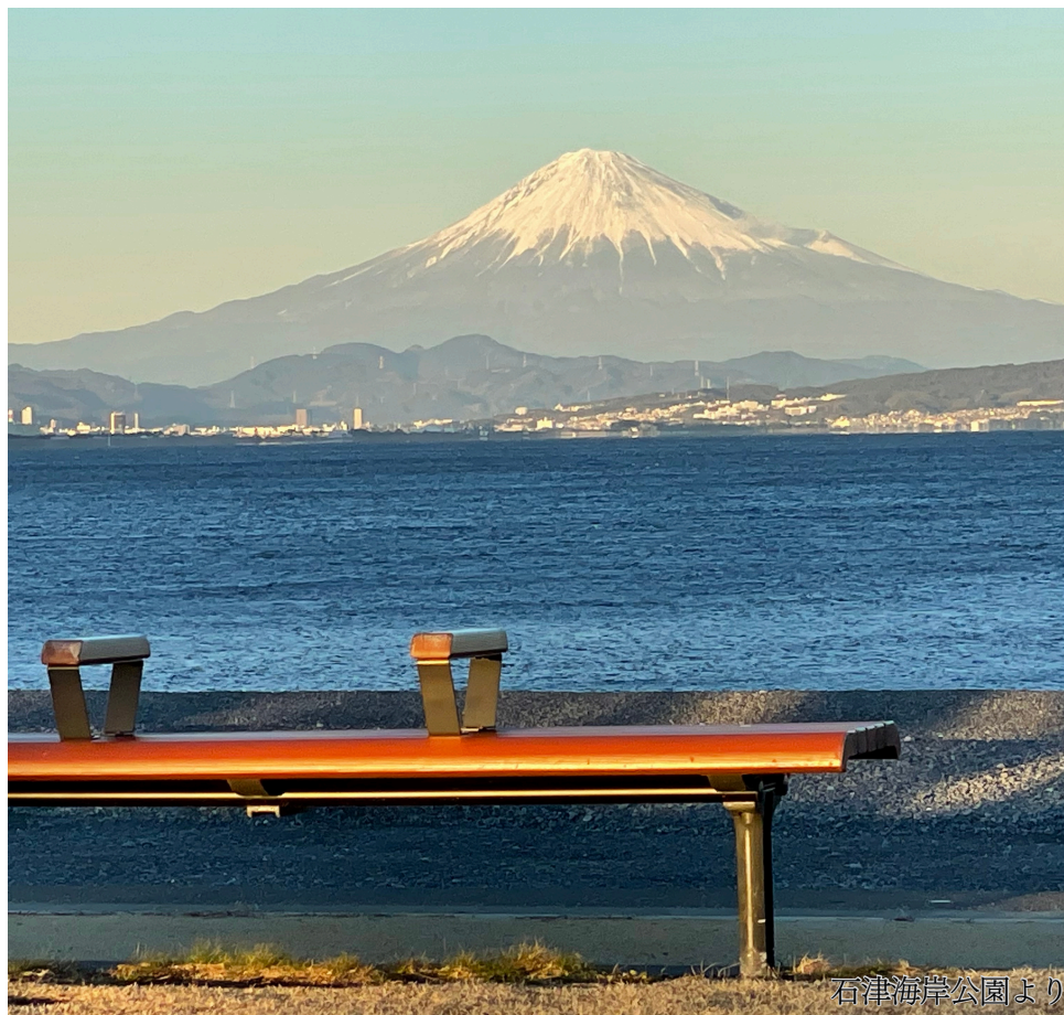
石津海岸公園より