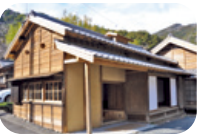
花沢地区 ビジターセンター

① 高草山石脇入口バス停より、舗装道路を30分ほど進むと花沢の里臨時駐車場に着きます。② そこからは昔懐かしい山村集落の面影が残る花沢の里では花沢川沿いに散策することが出来ます。(生活している集落住民に思いやりをもった散策をお願いします)③ 集落北端の法華寺を過ぎるとすぐに満観峰への登山口があります。少しのぼってから振り返ると、花沢の里全体が見渡せます。④ 途中、道路を横切りながら、山道をのぼっていくと、鞍掛峠に着きます。ここで右手に進み、満観峰に向かいます。(鞍掛峠を左手に進むと高草山山頂方面