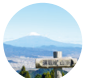
山頂からの 富士山絶景