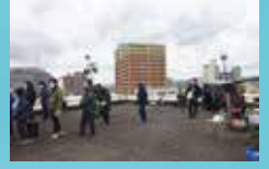
⑤焼津高校: オカジ(豊嶋花)、べっちゃん(長澤樹)の高校の場面。教室と屋上で、焼津高校と焼津水産高校の生徒、合わせて23名のエキストラも参加し撮影。●焼津市中港 1-1-8