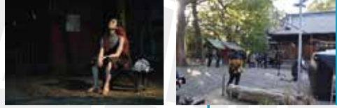
⑥熊野神社: 幼少期のちひろ(奈良瀨)がチヒロ(市川実和子)と出会い、自分で作った海苔巻きをチヒロに食べてもらった場所。境内の中にある小さな神社(那閉神社)で撮影されました。●焼津市東小川 5-9-3 ※熊野神社の御朱印は焼津神社で受付。

海辺の小さな街にやって来て、お弁当屋で働くちひろさん(有村架純)と街の人々が過ごした場所を訪れてみませんか？