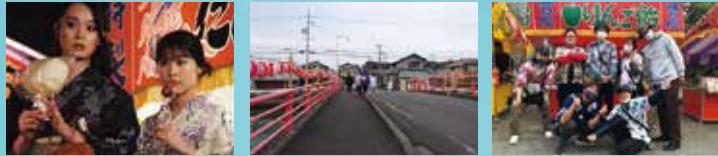
⑩石津水天宮: ちひろ(有村架純)とバジル(van)が縁日に出かけ、元風俗店店主(リリー・フランキー)と再会する場面。水天宮の総代の皆さんが祭典用の提灯、幟を準備。市民を中心に約120名のエキストラも出演。映画スタッフの皆さんも焼津名産「魚河岸シャツ」などを着用して参加しました。●焼津市石津港町 28