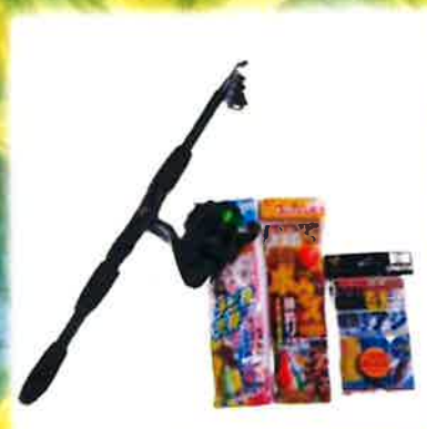
釣具のありまクン