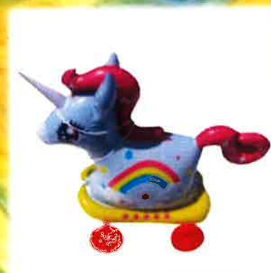
おもちゃのやすもり