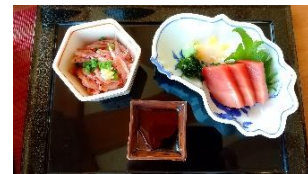
お刺身（桜えび・南まぐろ）