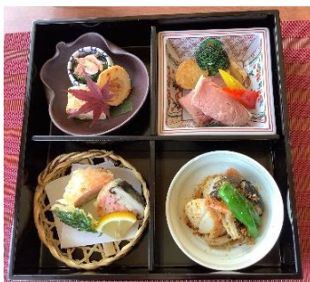
桜えび真丈 二身揚げ