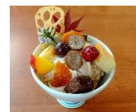
秋のフルーツの モンブラントライフル