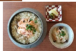
ご飯 桜えびの炊き込みご飯