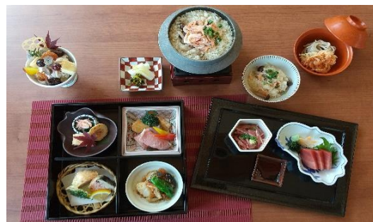
『松花堂 桜えびご膳』